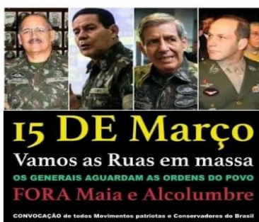
3 Convocação que circula nas redes sociais

No dia 25 de fevereiro de 2020, ganhou repercussão a grave notícia de que o Presidente da República estaria convocando, através de disparos de mensagens pela rede WhatsApp , arquivos de vídeo que convocam a população para ato marcado para o dia 15 de março, que tiveram como mote o fechamento do Congresso Nacional, do Supremo Tribunal Federal e, conseqüentemente, o ataque às instituições democráticas.