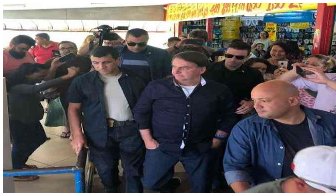
Bolsonaro na Ceilândia/DF

E para que não restassem dúvidas, no dia 19 de abril último o Denunciado participou de manifestação em frente ao Quartel General do Exército em Brasília, onde centenas de pessoas que se aglomeraram para, dentre outros, pedirem a volta do regime ditatorial no país e a instituição de um novo AI-5 28 .