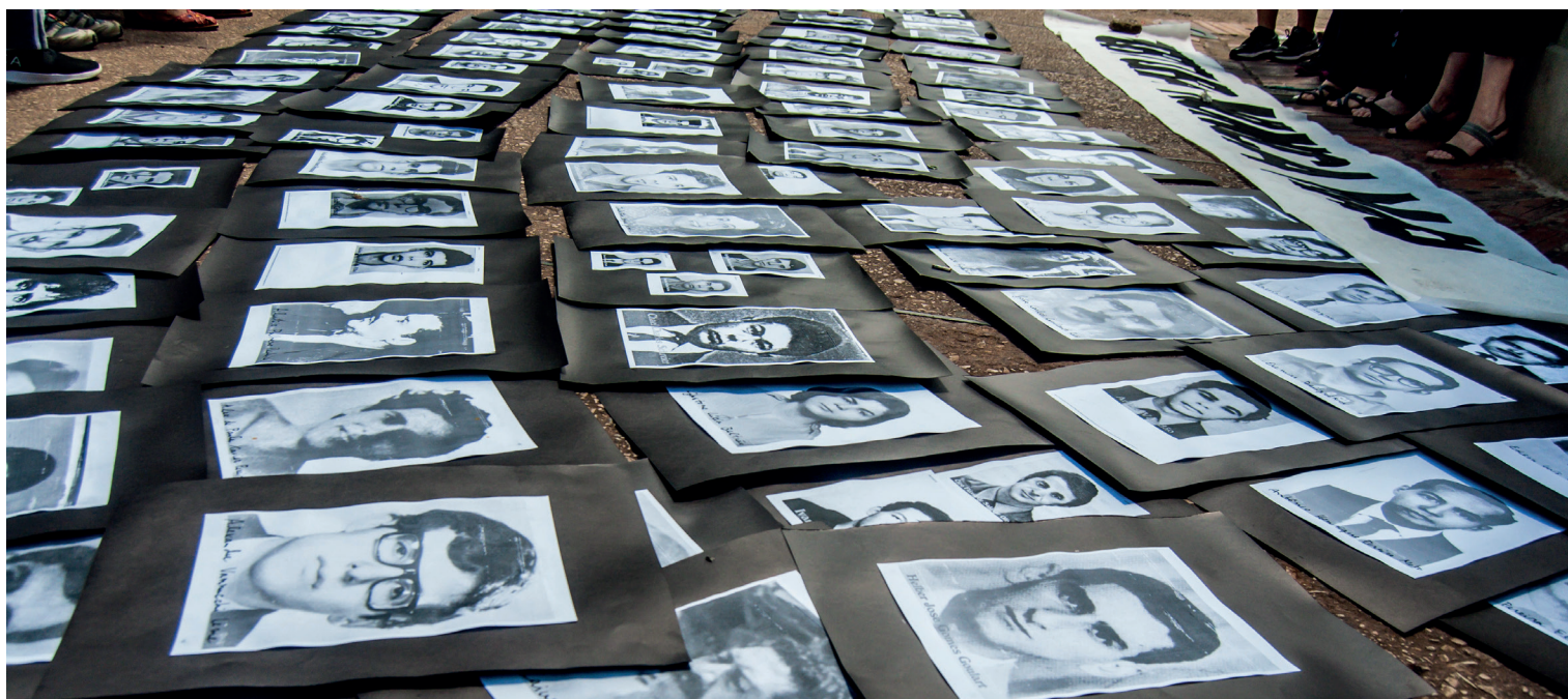
Ato realizado em Belo Horizonte (MG), em 31/3/2019, lembra os mortos e desaparecidos durante a ditadura militar.

Montadora entrou em acordo para indenizar em R$ 36 mi mais de 60 ex-funcionários e descendentes; investigação mostrou colaboração da Volks com ditadura brasileira