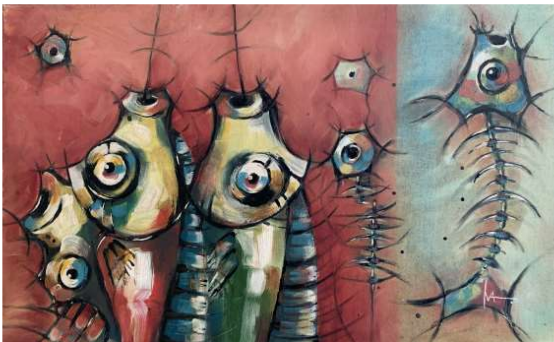
Obra “Eu SER Água” de Iva Tai. Técnica mista 128cmx111cm, 2015 (Acervo da Pinacoteca do Estado do Amazonas)

Nos tempos cinzentos em que a Amazônia, tantas vezes esquecida, é agora atracada pelo gélido abraço da necro-democracia viral, vemos sonhos, cores, esperanças e amores asfixiar. Dentre tantas painas jogadas nos braços do tempo, uma delas se destaca por brilhar em cores e movimentos contra as turvas do dito fim: a artista Iva Tai vítima da Covid-19.