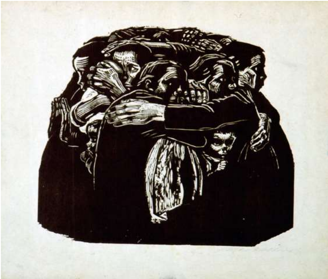
Obra 'As mães' de Kathe Kollwitz, Alemanha. Técnica de Xilogravura, 1923.

KÄTHE KOLLWITZ foi desenhista, escultora e gravadora alemã, nasceu na pequena cidade de Königsberg, em 8 de julho de 1867. Käthe Kollwitz produziu muito em toda sua vida, sempre com foco nos oprimidos, nos famintos, nos injustiçados desenhando cartazes e fazendo ilustrações e xilogravuras denunciando as condições de trabalho, especialmente a situação de vida das mulheres. Desenhou para várias lutas sindicais, entre elas, para o Sindicato das Comunas da Grande Berlim, que denunciava a grande escassez de moradias na cidade. Sofreu censura do governo nazista, como havia sofrido dos imperadores. Se impôs como artista e foi ativa na luta por mais direitos para as mulheres.