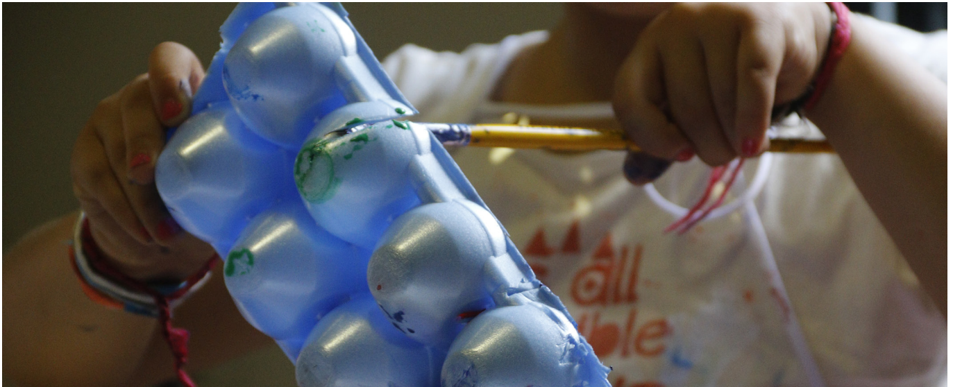
Espaço de convivência do 38º Congresso ANDES-SN agradou pais e filhos

E nquanto os adultos debatem a luta em defesa da educação pública no Brasil, as crianças desenham, pintam, brincam de massinha, veem filmes, jogam bola, pulam na piscina e aprendem. Desde segunda-feira (28), esse tem sido o dia a dia no espaço de convivência do 38º Congresso do ANDES-SN, que acontece até o dia 2 na Universidade Federal do Pará (UFPA), em Belém.