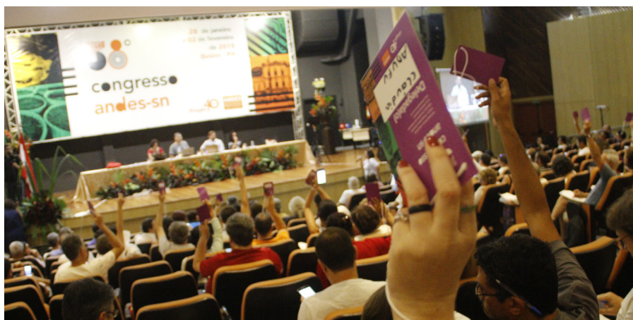
31.01 - Delegados e delegadas em votação no 38º Congresso do ANDES-SN

O Sindicato Nacional também construirá, via secretarias regionais, plenárias estaduais como preparação para a plenária das centrais. A plenária é uma