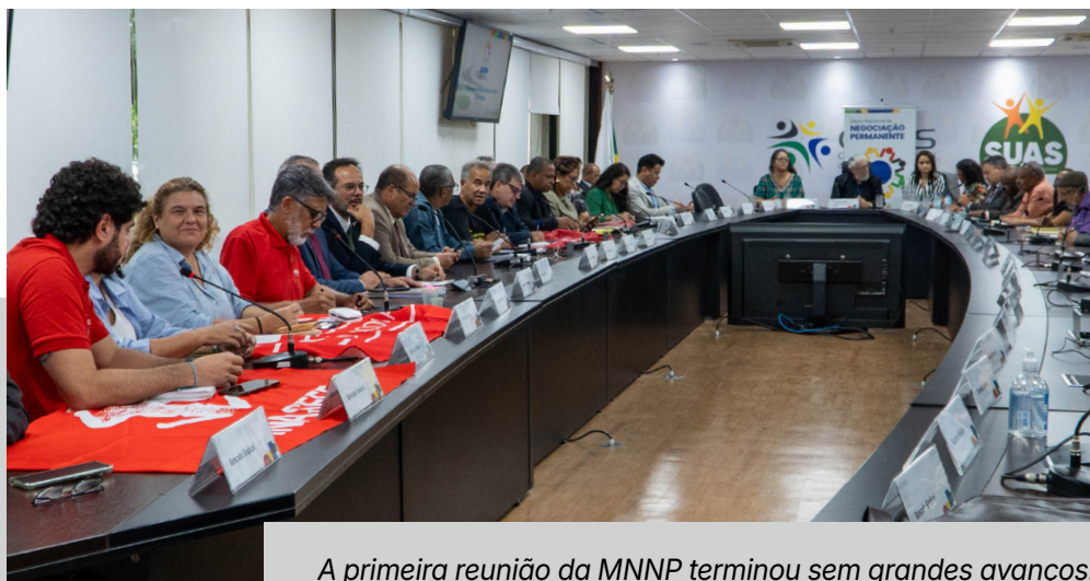
A primeira reunião da MNNP terminou sem grandes avanços.

O ANDES-SN participou, no dia 10/3, de reunião da Mesa Setorial de Negociação Permanente, no âmbito do Ministério da Educação (MSNP-MEC), sobre a Instrução Normativa 15/2022, que cria obstáculos à concessão do adicional de insalubridade. As entidades da educação criticaram a demora em revogar a medida. "Essa mentalidade que isenta a responsabilidade do Estado com relação à saúde, à dignidade do trabalho, é uma mentalidade bolsonarista", afirmou a secretária-geral do ANDES-SN. Um parecer técnico da Assessoria Jurídica Nacional (AJN) do ANDES-SN sobre a IN 15 foi encaminhado ao MEC.